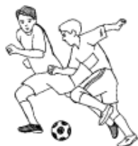
ХОККЕЙ И ФУТБОЛ