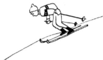
ЛЫЖНИК И ГОРНОЛЫЖНИК