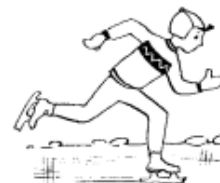
ФИГУРИСТ И КОНЬКОБЕЖЕЦ