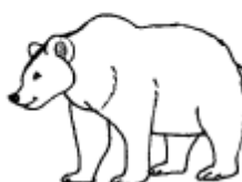
белый медведь и бурый медведь