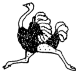
пингвин и страус