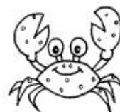
рак и краб