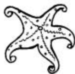
медуза и морская звезда