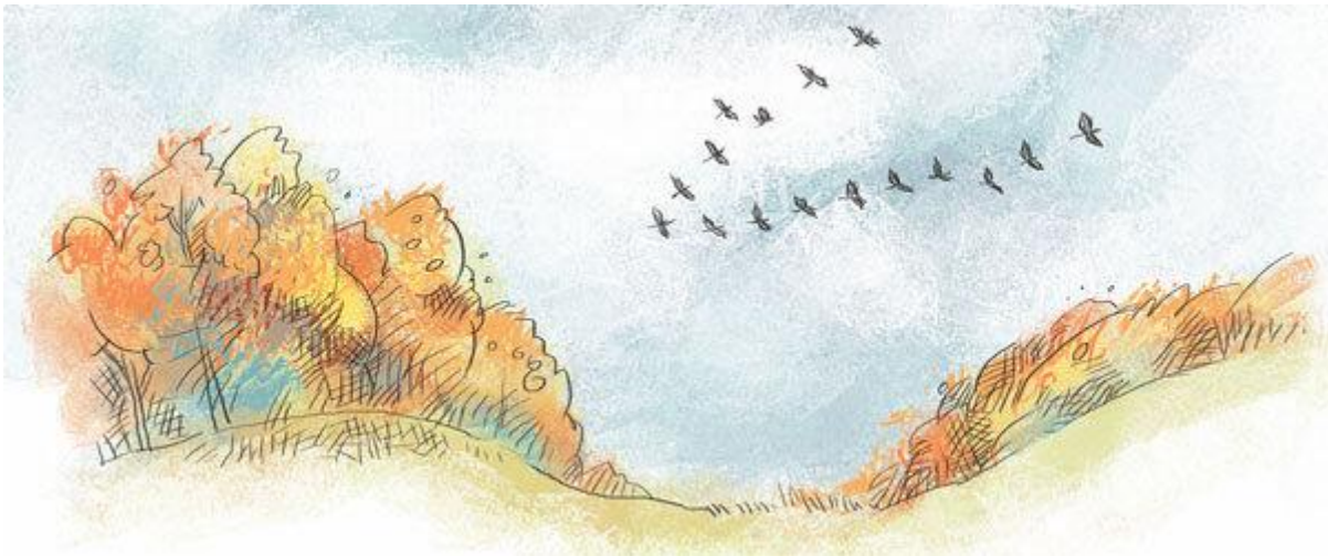
КЛИН ЖУРАВЛЕЙ (картинка с сайта znaew.ru)