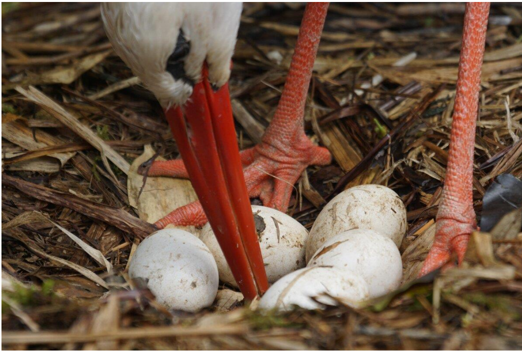
ЯЙЦА АИСТА