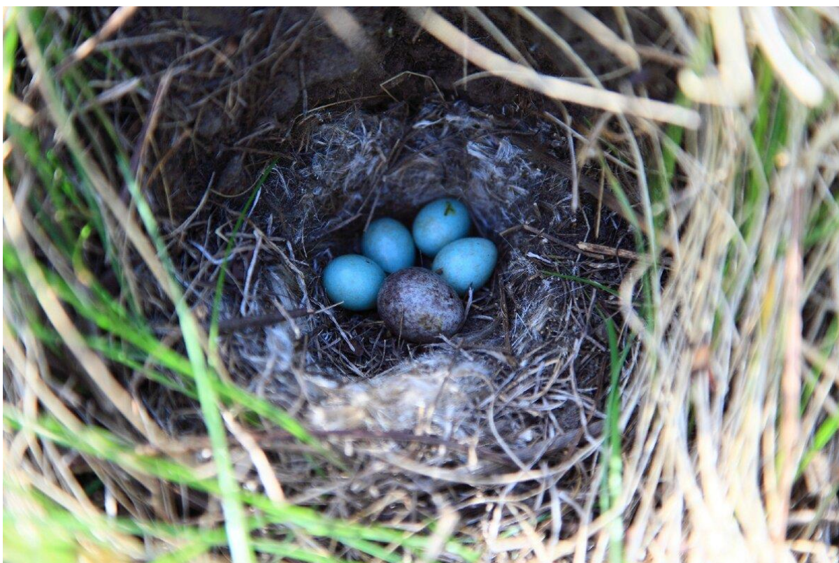
ЯЙЦА КУКУШКИ

♥ Расскажите ребёнку, что все птенцы птиц (в том числе и перелётных) появляются из яйца. Рассмотрите вместе с ребёнком фотографии.