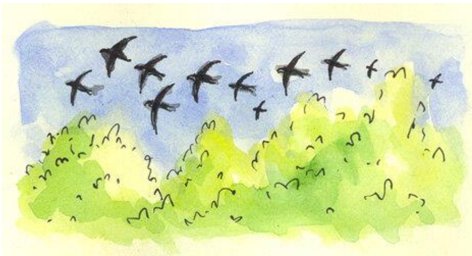
ВЕРЕНИЦА ЛАСТОЧЕК (картинка с сайта diary.ru)