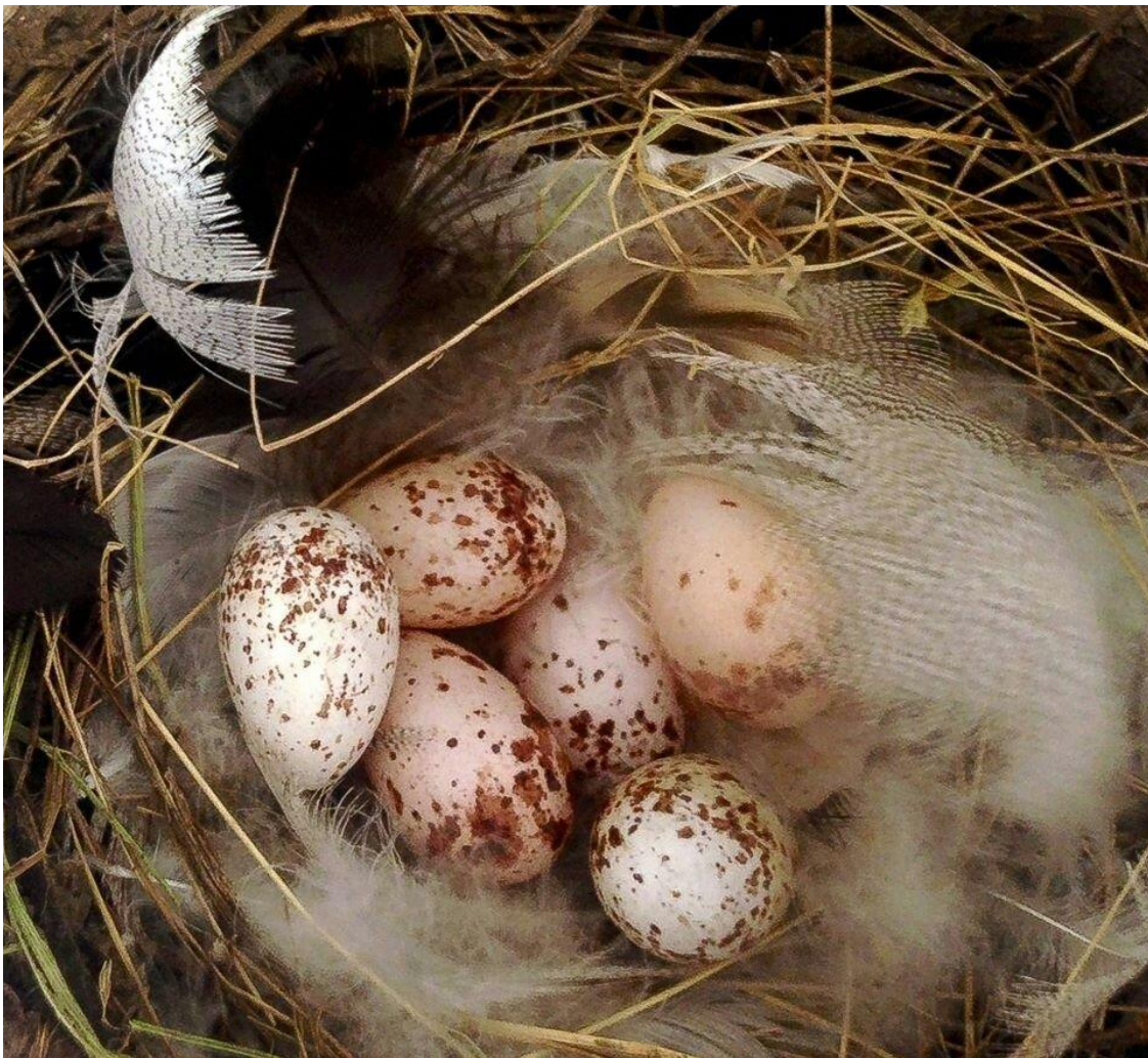
ЯЙЦА ЛАСТОЧКИ