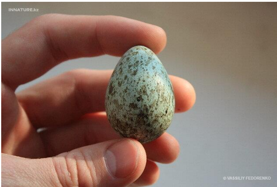
ЯЙЦО ГРАЧА