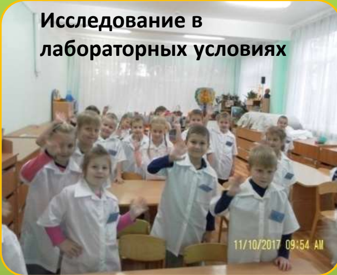
Исследование в лабораторных условиях