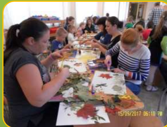
Мастерская «Природные чудеса в умелых руках»