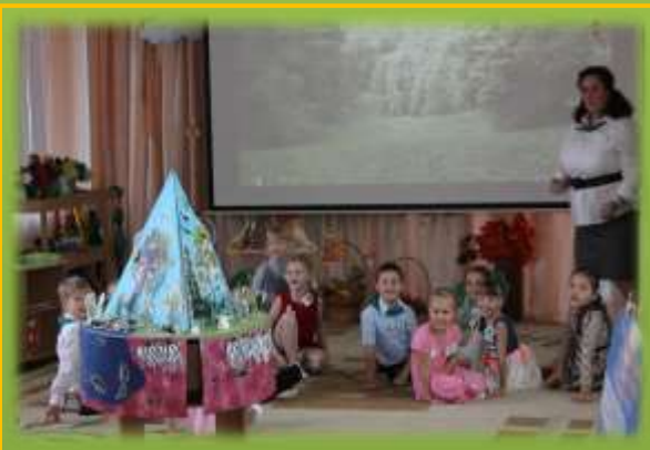
Викторина «Все связано со всем»