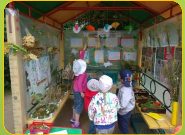
Мини- музей под открытым небом